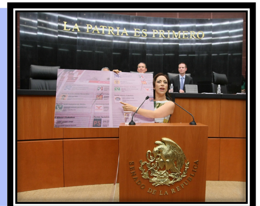
Exponiendo el fraude cometido en el proceso electoral local de Tlaxcala de 2013

Varios de los argumentos sobre el intento de fraude en 2013 en Tlaxcala, fueron expuestos para realizar las modificaciones al marco normativo electoral.