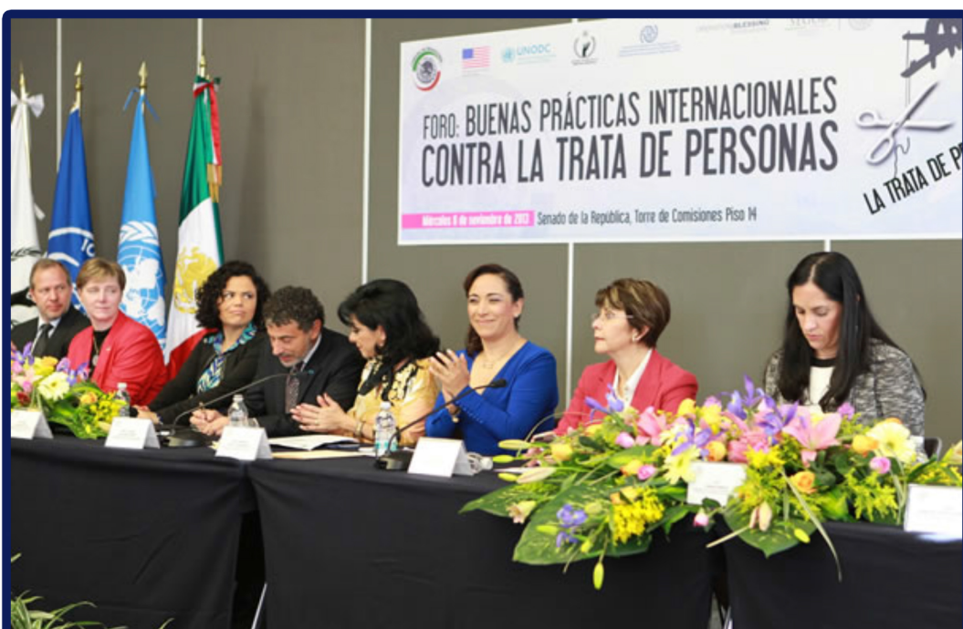
En el Presidium autoridades federales, organizaciones internacionales y Senadoras de la Comisión contra la Trata de Personas del Senado de la República