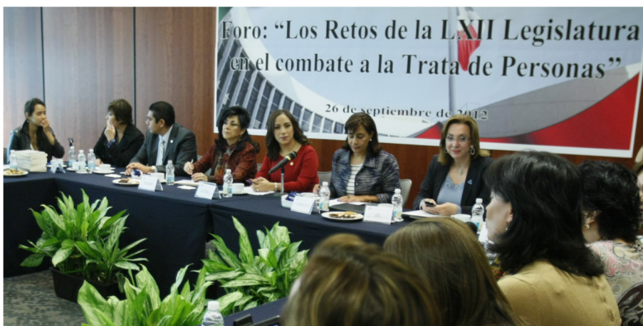
Interés de la sociedad civil por conocer la agenda legislativa en la materia