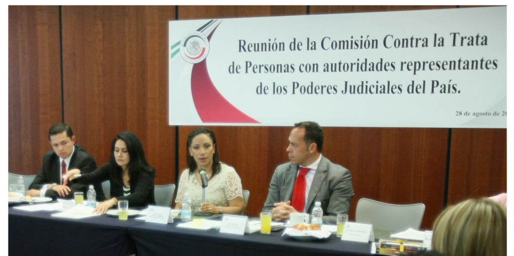
La Senadora Adriana Dávila Fernández explica a representantes de los poderes Judiciales del país, el contenido de la Iniciativa.