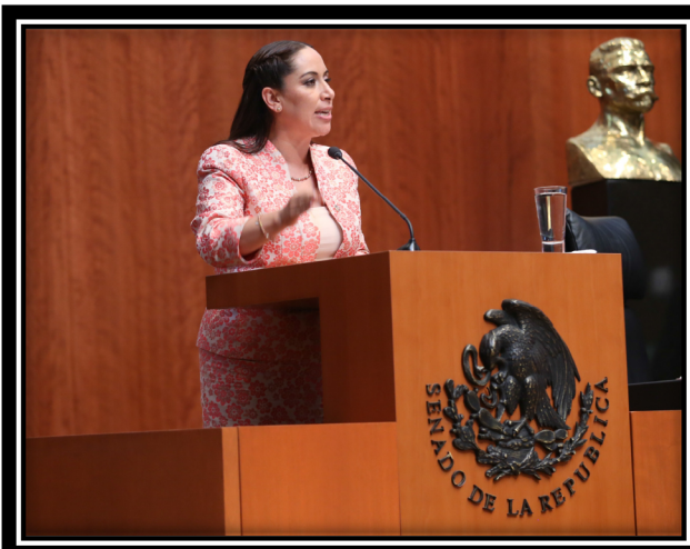
Posicionamiento del Grupo Parlamentario en la aprobación de la Ley General de los Derechos de Niñas, Niños y Adolescentes