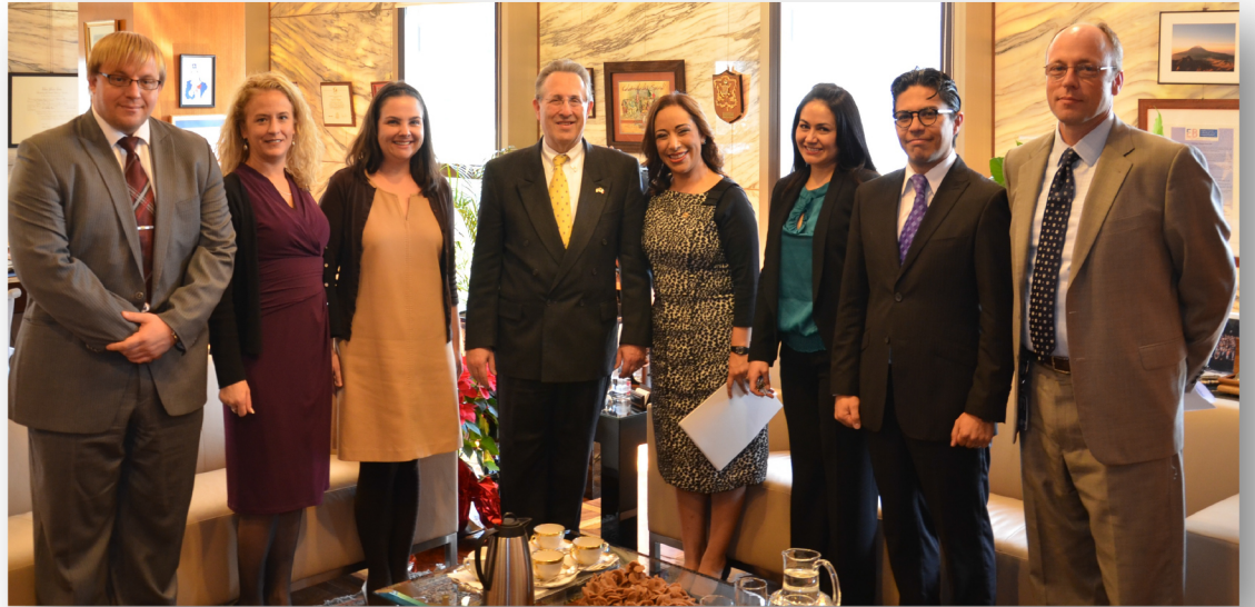
En reunión con Earl Anthony Wayne, Embajador de los EU en México y funcionarios de la Embajada responsables del combate al delito de trata de personas