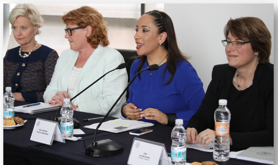
Reunión Amy Klobuchar, Senadora por Minnesota, Mary Kathryn Heitkamp, Senadora por Dakota del Norte, Cindy McCain, esposa del Senador John McCain.