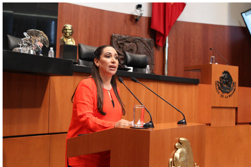
Presentación de Iniciativa de Ley