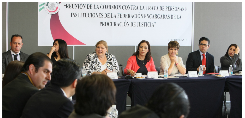
Representantes de las Procuradurías de Justicia estatales, y del Distrito Federal, opinando sobre los trabajos del Senado para las modificaciones de la Ley General.