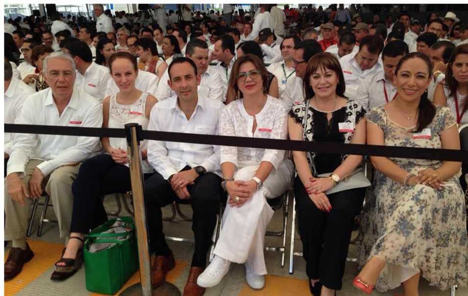
Senadores en el arranque del Programa Frontera Sur del Gobierno Federal