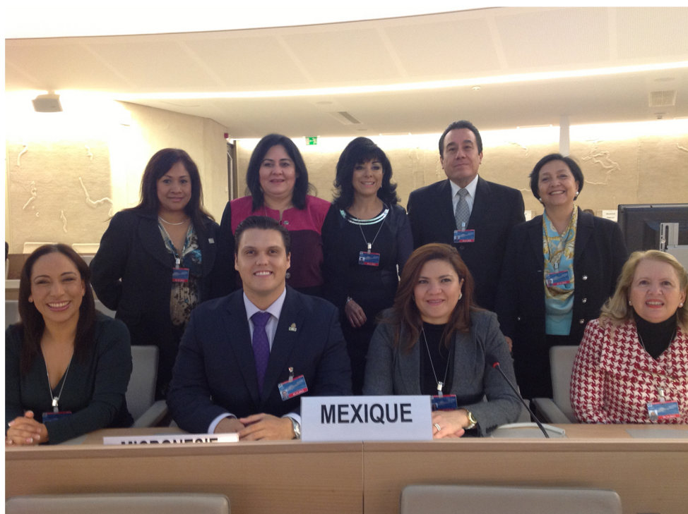
En la Segunda Evaluación del Estado Mexicano ante el Mecanismo de Examen Periódico Universal del Consejo de Derechos Humanos de la Organización de las Naciones Unidas, en Ginebra, Suiza