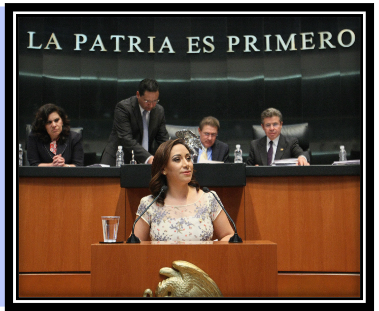
Participación en Tribuna sobre la Reforma en Telecomunicaciones

Parte de las propuestas que se aprobaron en esta reforma, fueron presentadas cuando fui Diputada Federal, el 23 de noviembre de 2006 y el 7 de Diciembre del mismo año.