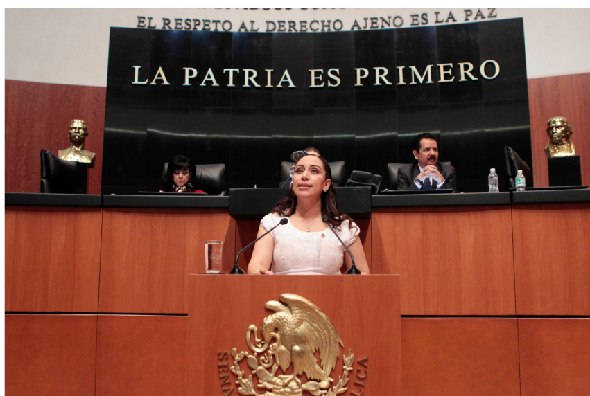
Presentando Punto de Acuerdo