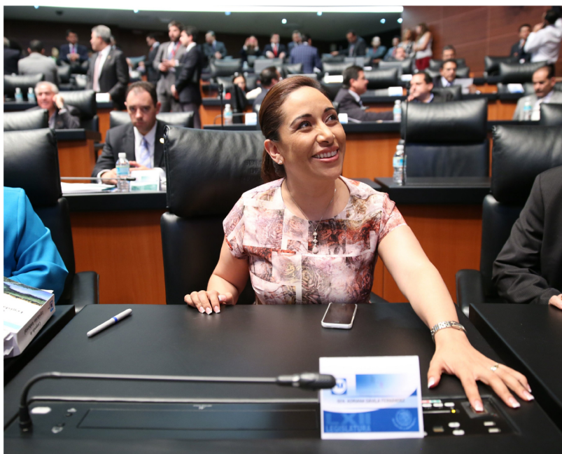
En votación nominal sobre dictámenes