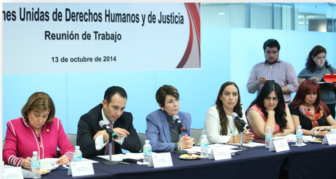
En Comisiones Unidas se discutió el nombramiento del nuevo titular de la CNDH