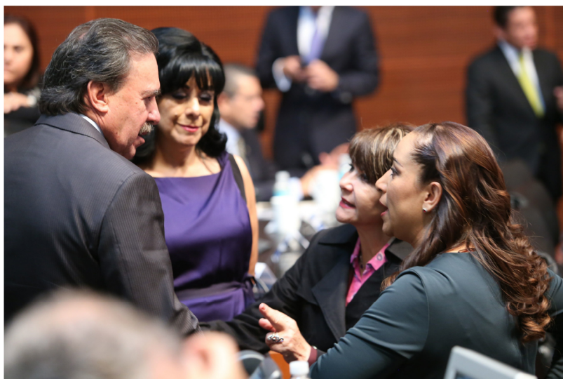
Compartiendo puntos de vista con Senadoras y Senadores de otros Grupos Parlamentarios