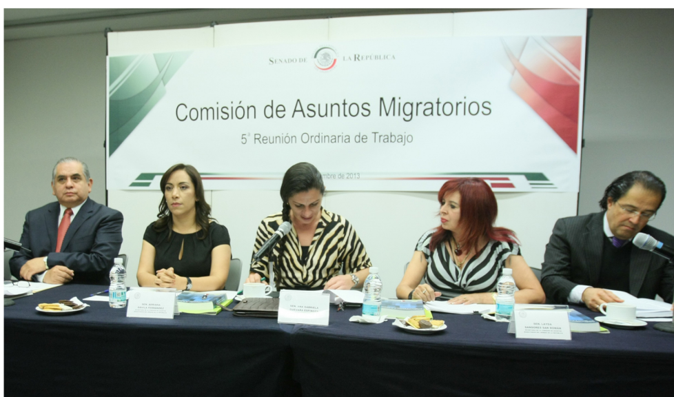
De gran relevancia resultó la 5ª Reunión de trabajo de la Comisión de Asuntos Migratorios