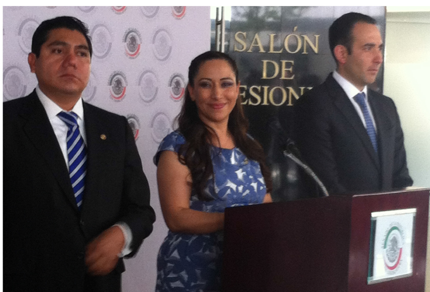
En Rueda de Prensa con el Coordinador del GPPAN Jorge Luis Preciado y con el Senador Roberto Gil Zuarth