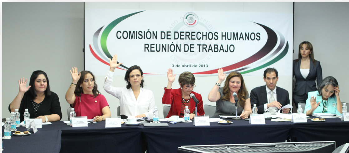
Votación de dictámenes discutidos en el pleno de la Comisión