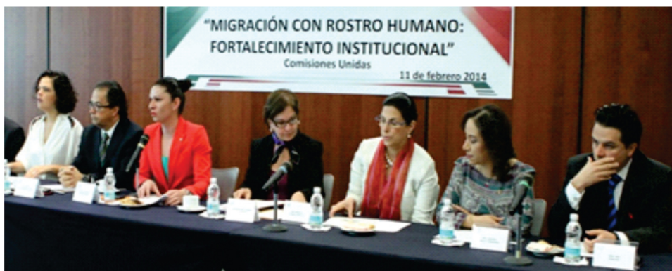
Asistencia en el Foro "Migración con Rostro Humano: Fortalecimiento Institucional"