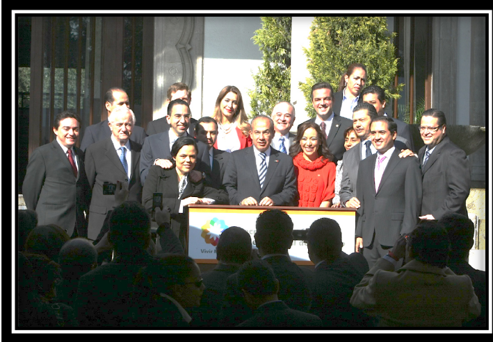
Promulgación de la Reforma Laboral en la Residencia Oficial de los Pinos: 2012

Todas estas reformas, fueron aprobadas luego de grandes debates entre los distintos grupos parlamentarios, foros con expertos, discusiones técnicas incluso polémicas, sesiones en Comisiones y en el pleno que tuvieron largas duraciones, pero que al final permitieron a todas y todos los actores involucrados plantear sus puntos de vista respecto de los distintos temas aprobados.