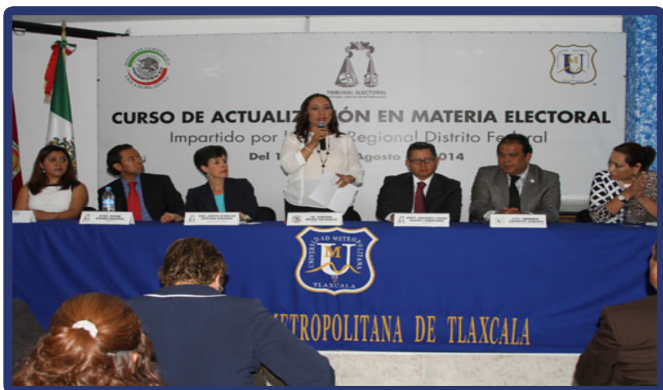
FORO: Reforma Político Electoral: Curso de Actualización en Materia Electoral LUGAR: Universidad Metropolitana FECHA: Agosto de 2014 ENCABEZA: Magistrados Electorales de Sala Regional del DF. Cuarta Circunscripción