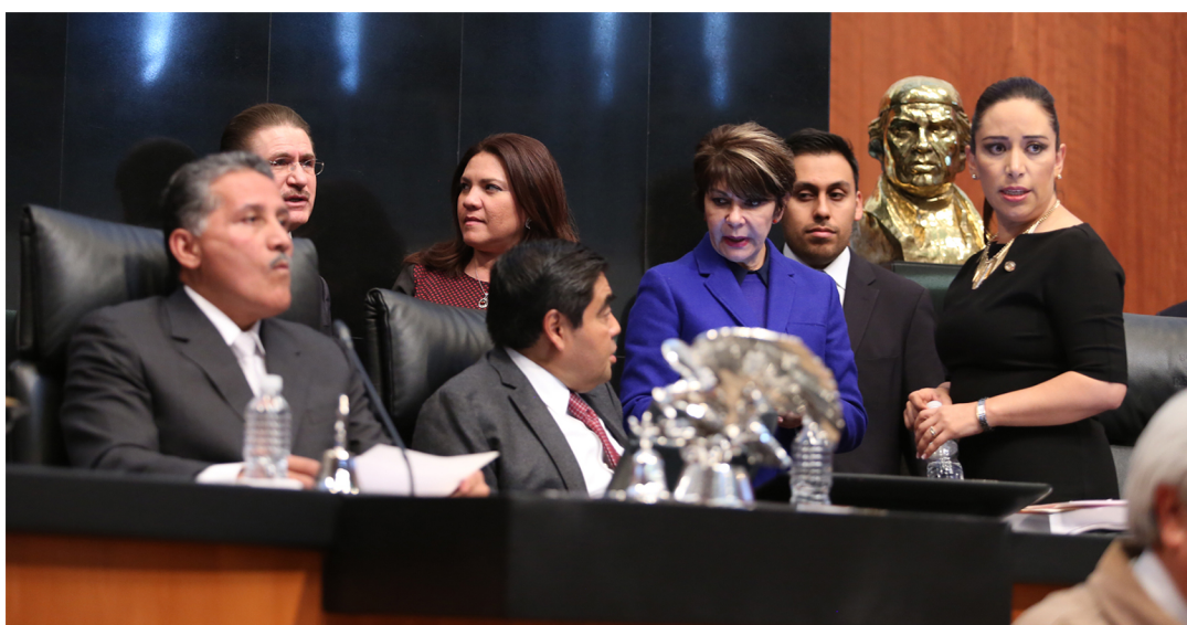
En debate con el presidente de la mesa directiva del Senado, Miguel Barbosa, Senadoras y Senadores de distintos grupos parlamentarios