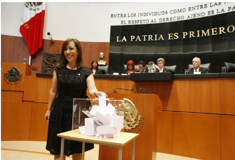
Votación nominal para elegir mesa directiva

Quiero destacar que algunas de mis propuestas han tenido impacto en las grandes reformas que se han llevado a cabo en el Congreso de la Unión. Por ejemplo, en la reforma político electoral aprobada a finales de 2013, se incluyeron entre otras, el cambio de fecha para la Toma de Protesta del Titular del Ejecutivo, así como la duración de los periodos legislativos y la autonomía del CONEVAL.