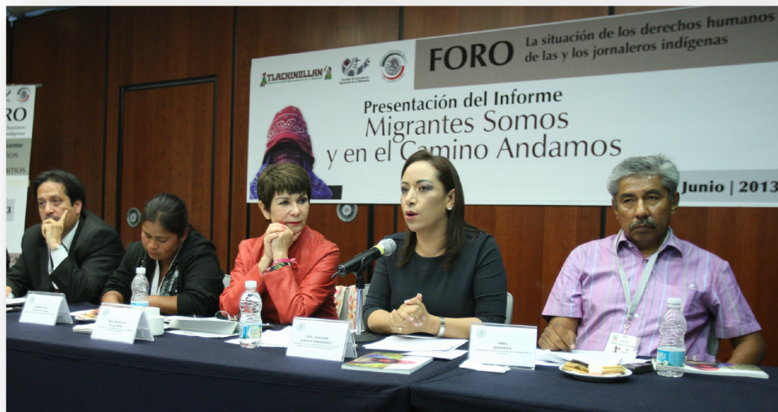
Compartiendo foro con la presidenta de la Comisión de Derechos Humanos, la Senadora Angélica de la Peña