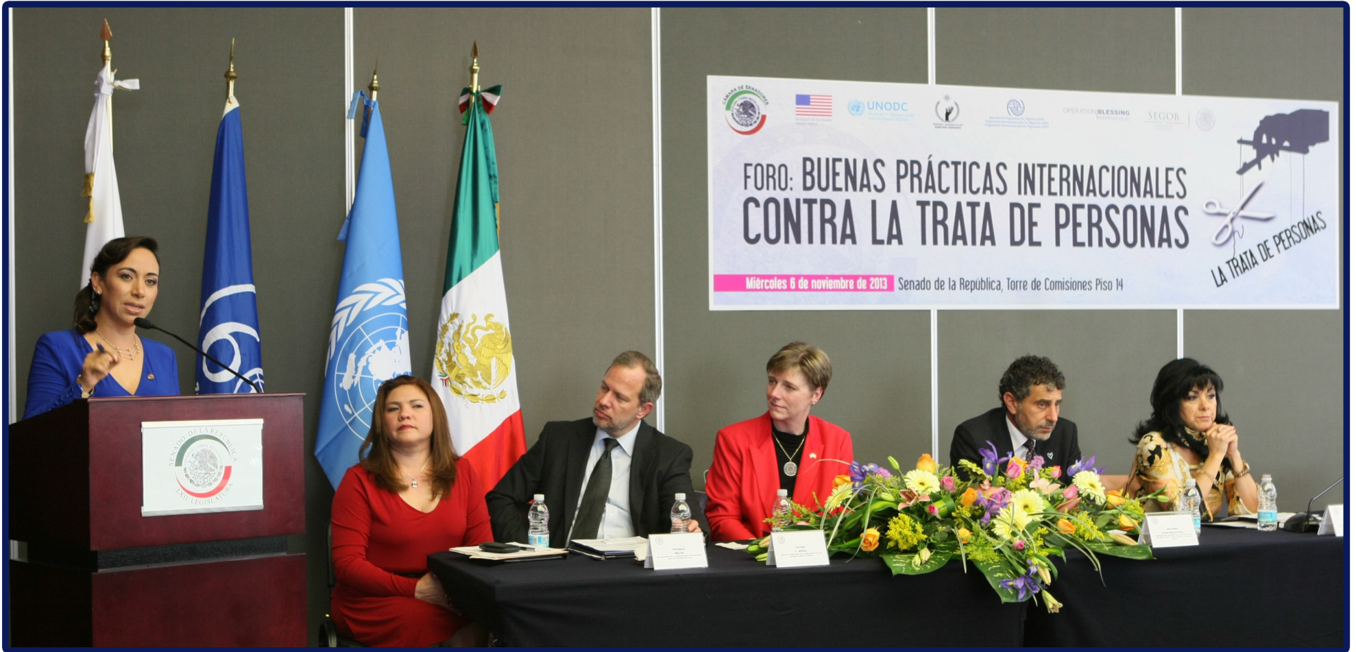
Inauguración del Foro Buenas Prácticas Internacionales Contra La Trata de Personas, asistieron representantes de la OIM, de la UNODC de la CNDH y de la Asociación Internacional "Operación Bendición Latinoamérica"

De igual forma realizamos en coordinación con la CNDH, la OIM, la UNODC, y la Asociación Internacional "Operación Bendición Latinoamérica", organizamos el Foro: "Buenas Prácticas Internacionales Contra la Trata de Personas" con el fin de conocer de personas expertas y sobrevivientes de otros países las prácticas efectivas en materia de prevención, detección del delito, persecución, sanción y por supuesto de la protección asistencia a las víctimas. Participaron autoridades y asociaciones civiles de todo el país y otras partes del mundo.