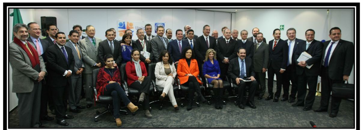
Reunión del Grupo Parlamentario del PAN con el Consejo Coordinador Empresarial para tratar los temas fiscales

El Grupo Parlamentario del PAN en su conjunto votó en contra de la Reforma Fiscal, por que atenta contra los bolsillos de los ciudadanos, impide el crecimiento económico del país y evita la generación de empleos. Afecta principalmente a las calses sociales más desprotegidas y a la clase media le impone una carga fiscal más alta.