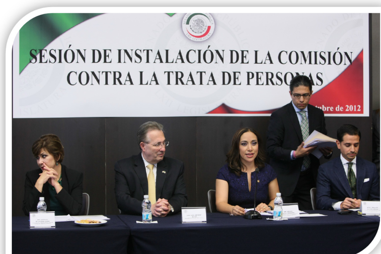
Primer mensaje como presidenta de la Comisión contra la Trata de Personas del Senado, ante Senadoras integrantes de la misma e invitados especiales

Nos comprometimos a colaborar con las instituciones que combaten este delito desde sus ámbitos de competencia y ofrecer todos nuestros esfuerzos para generar un instrumento legislativo que combata y castigue eficazmente a quienes cometen este delito.