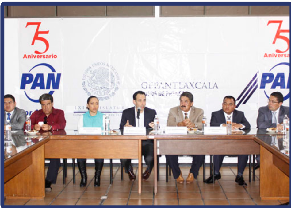
FORO: Reforma Político Electoral LUGAR: Congreso del Estado y Comité Directivo Estatal del PAN FECHA: Junio de 2014 ENCABEZA: Sen. Roberto Gil Zuarth, Presidente de la Comisión de Justicia