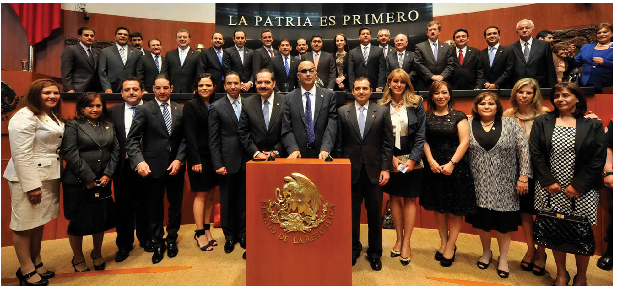
Integrantes del Grupo Parlamentario del PAN en el Senado de la República. En honor a Alonso Lujambio †