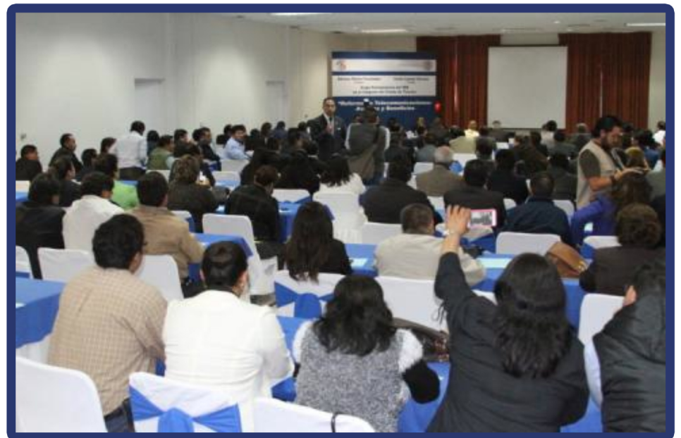
FORO: Reforma en Telecomunicaciones LUGAR: Hotel Posada San Francisco FECHA: Julio de 2014 ENCABEZA: Sen. Javier Lozano Alarcón, Presidente de la Comisión de Telecomunicaciones