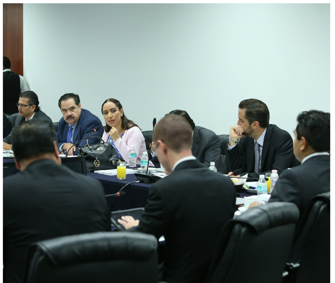
Reunión de trabajo con el Presidente del Partido Acción Nacional (PAN), Ricardo Anaya, para exponer algunos de los temas de las iniciativas y puntos de acuerdo que presenté.