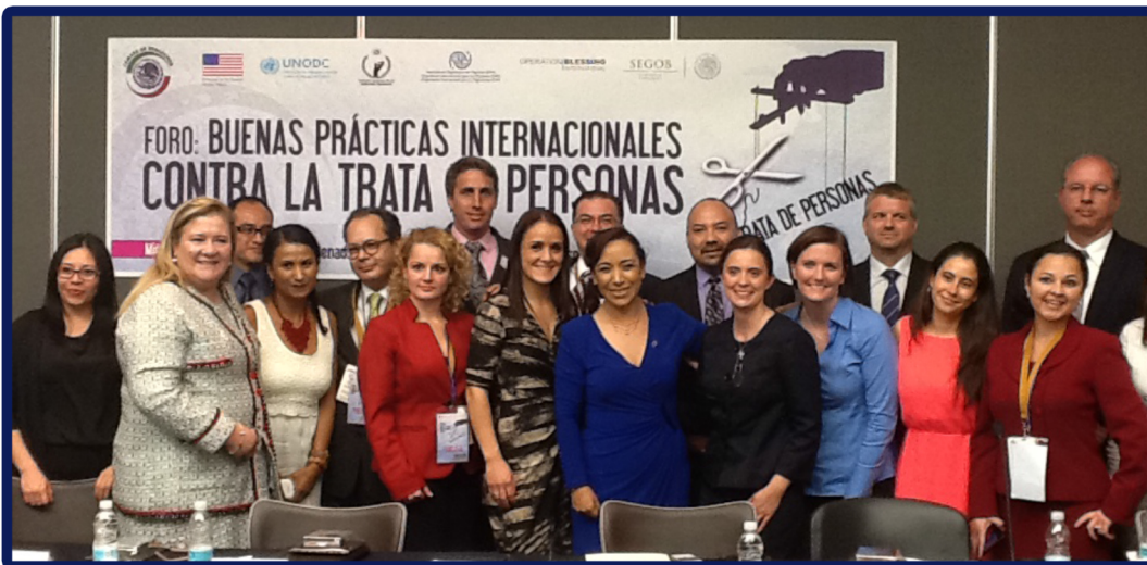
Panelistas, ponentes y expertos que participaron en este Foro