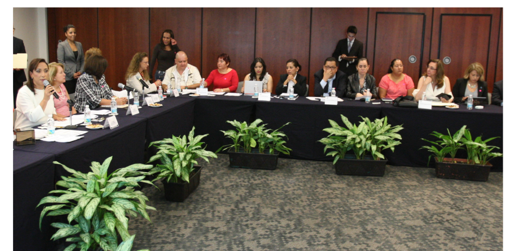
Reunión con representantes de la Sociedad Civil para discutir el tema de la Trata