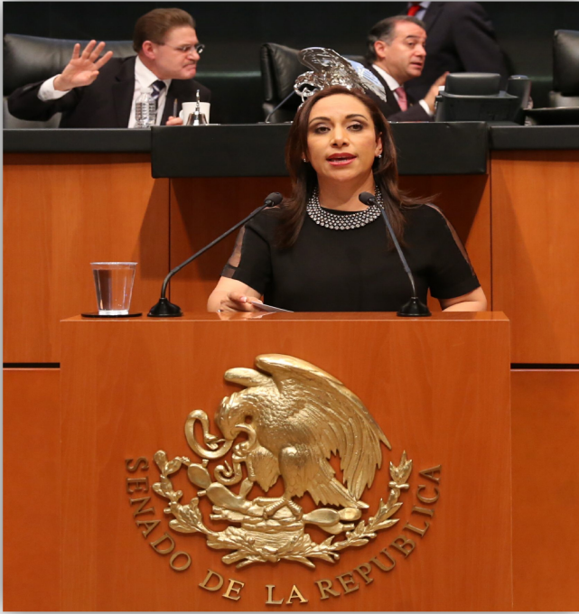
Presentando iniciativa de Ley

El trabajo legislativo en la Cámara de Senadores, generalmente se encuentra definido por las agendas planteadas por los diversos Grupos Parlamentarios que la conformamos. En los distintos órganos de dirección como la Mesa Directiva y la Junta de Coordinación Política, se van planteando los temas que deberán tratarse en cada sesión de trabajo y en cada periodo de sesiones.