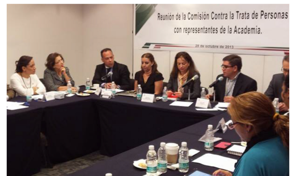
Integrantes de la Comisión Contra la Trata de Personas en reunión con académicos expertos en el tema