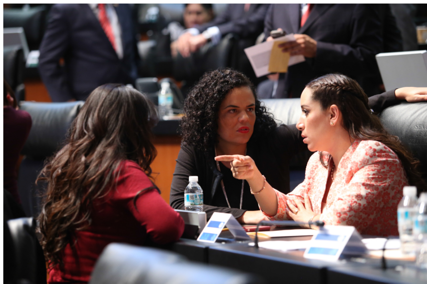
Compartiendo puntos de vista sobre temas legislativos con las Senadoras Sonia Mendoza y Mariana Gómez del Campo